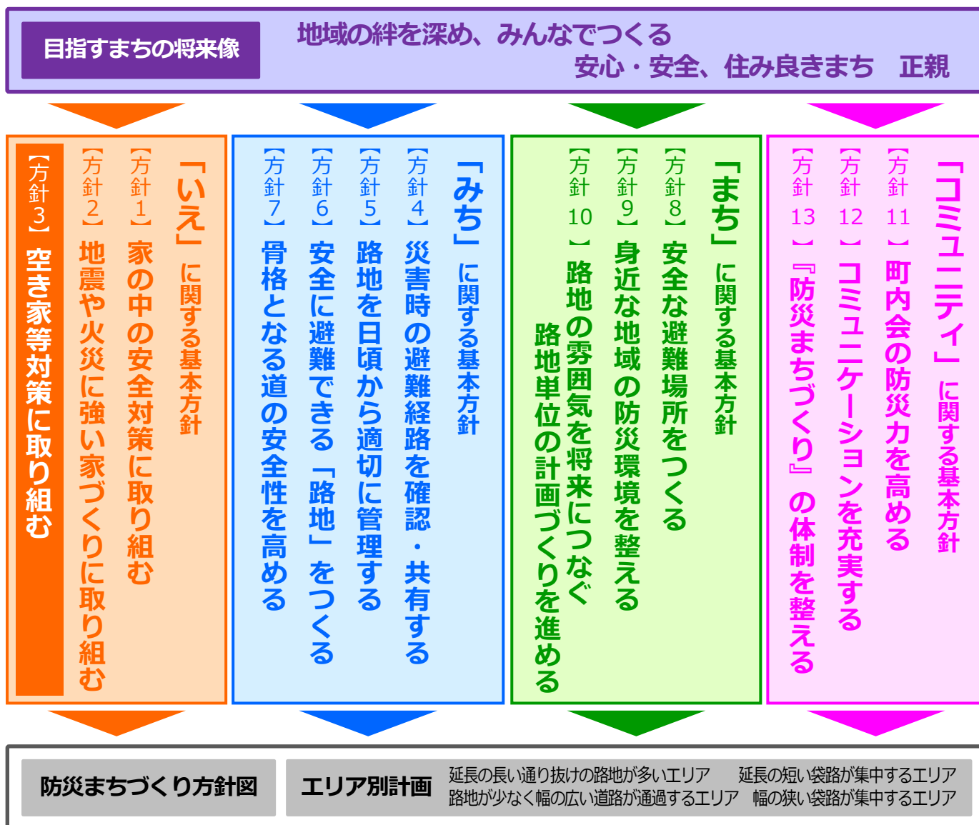
《正親学区 防災まちづくり計画の概要》

正親学区では、平成27年度からの3年間の取組の中で、住民のみなさんから頂いた意見を踏まえて、平成30年3月に『 正親学区 防災まちづくり計画 』をとりまとめました。今後は、この『防災まちづくり計画』に基づいて「 防災まちづくり 」を進めていきます。